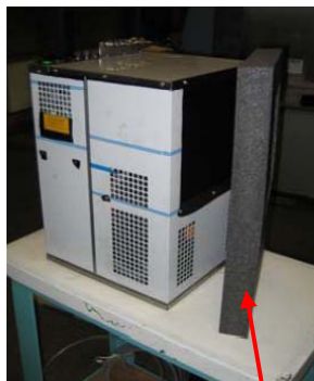
Geräte-Rückseite Schalldämpfplatte (6cm breit) und "Abluftkanal"

→ Kann auch als Schablone für die Zuluftöffnung der Kasten-Rückwand verwendet werden!