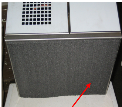
Geräte-Unterseite mit Schalldämpfplatte (2cm breit)